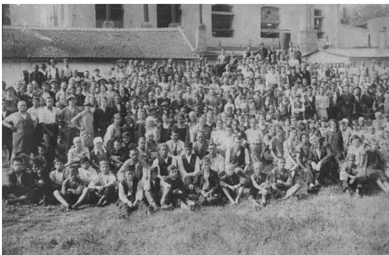
Radnici Srpske fabrike stakla, 1929. godina, Paraćin