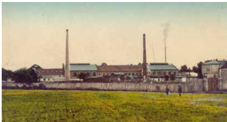
Srpska fabrika stakla u Paraćinu između dva svetska rata