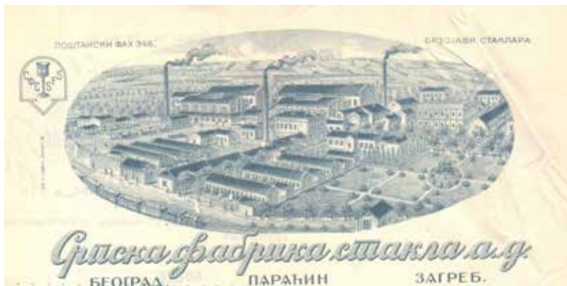
Memorandum Srpske fabrike stakla sa izgledom fabrike krajem 30-ih godina 20. veka