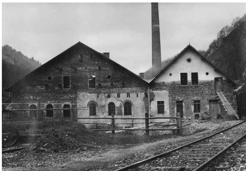
Objekti fabrike stakla Hrastnik, 1908.